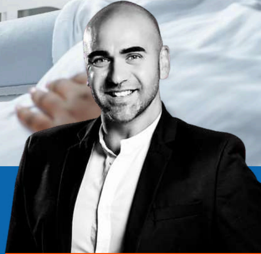
Hoof Uitvoerende Direkteur/ Chief Executive Director