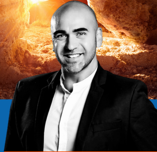
Hoof Uitvoerende Direkteur / Chief Executive Director